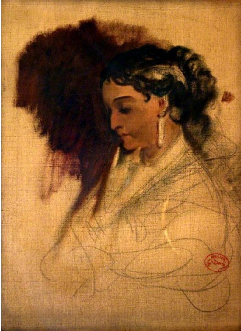
Gustave Doré: Madam Adelina Patti. Olew a siarcol ar gynfas. 52.5 x 37cm. Oriol Gelf Glynn Vivian.

Gustave Doré a'r Paradocs o Gyferbynnu Tonaidd Llinellau